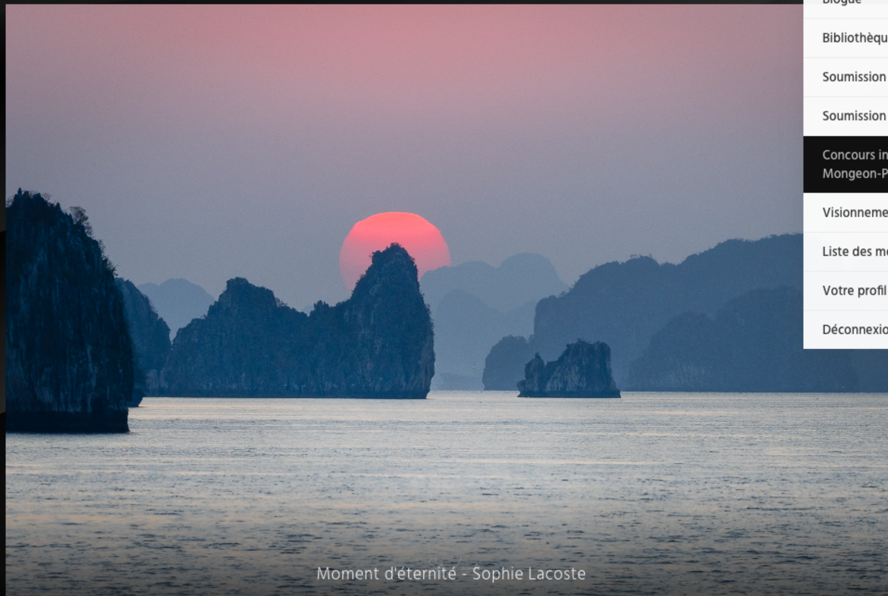
Moment d'éternité - Sophie Lacoste